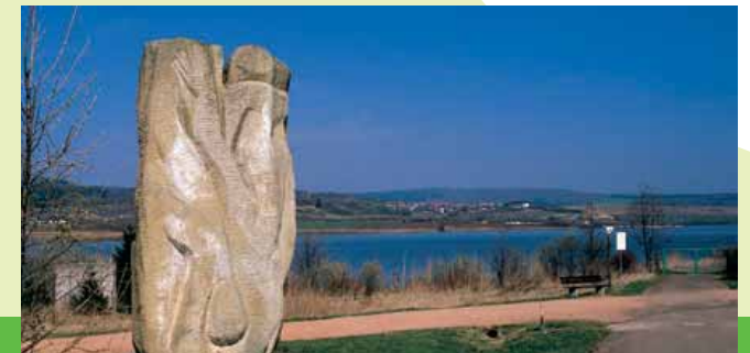
Skulptur von Selinger am Bostalsee

Endpunkt: E Linie R2, Haltestelle St. Wendel Bahnhof