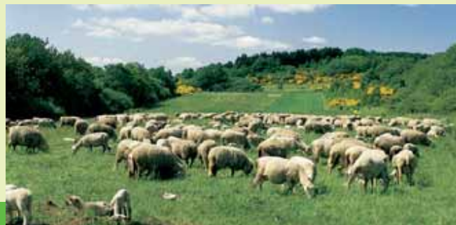
St. Wendeler Land

Endpunkt: E Linie R2, Haltestelle St. Wendel Bahnhof