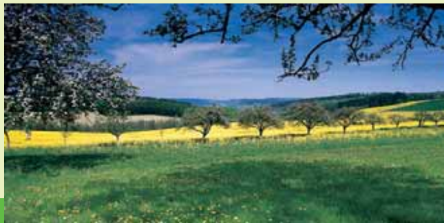
Natur pur erleben

Streckenlänge: ca. 15 km Wander-Zeit: ca. 3,5 Std. Sehenswürdigkeiten: Naturschutzgebiet Tiefenbachtal und Osterwiesen • Völkerkundliches Museum im Missionshaus Startpunkt: S Linie R2, Haltestelle St. Wendel, Bahnhof Endpunkt: E Linie R2, Haltestelle St. Wendel, Bahnhof