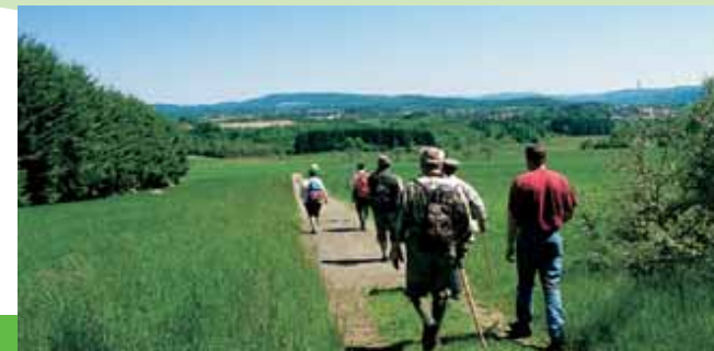
Zu Fuß auf Touren