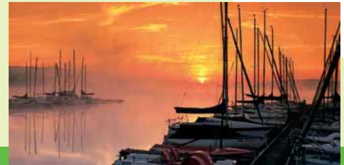
Morgenstimmung am Bostalsee

Streckenlänge: ca. 22 km Wander-Zeit: ca. 5 Std. Sehenswürdigkeiten: Steinbildhauersymposion • Millpetersch Haus in Gudesweiler • Wildfrauenhöhle • Naturschutzgebiet Oberthaler Bruch • Bostalsee • Nahequelle Startpunkt: S Linie R2, Haltestelle St. Wendel, Bahnhof Endpunkt: E Linie R2, Haltestelle Selbach