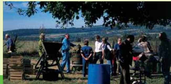
Kelterfest in Merzig – Panoramaweg

Ausgangspunkt ist die Haltestelle Brotdorf „Germania“. Über die „Provinzialstraße“ erreichen Sie links den „Rundwanderweg Merzig“ (M). Nach ca. 800 m überqueren Sie die Landstraße. Der Weg steigt den Hang hinauf und trifft auf den Wanderweg 8. Hier biegen Sie links ab. Nach etwa 150 m gehts weiter auf dem Weg scharf rechts. Nach ca. 1 km erreichen Sie Merchingen. Im Ort treffen Sie auf die Wegemarkierung des „Streuobstwanderweges“. Sie überqueren die „Honzrather Straße“ und gelangen über die „Friedrichstraße“ und den „Saarlouiser Weg“ auf den „Streuobst-Wanderweg“ Richtung Merzig. Durch Feld und Flur, vorbei an Streuobstwiesen und dem Sonnenstein führt Sie der Weg erst nach Bietzen und dann nach Harlingen. Ab dem Ortsausgang Harlingen läuft der „Streuobst-Wanderweg“ parallel mit dem Merziger Panoramaweg bis nach Merzig, dem Endpunkt dieser Tour. Genießen Sie die schöne Aussicht auf das Saartal und den gegenüberliegenden Saargau. Vom Merziger Bahnhof aus können Sie mit der Buslinie R1 nach Wadern fahren, wo Sie in die Buslinie R2 Richtung St. Wendel umsteigen.