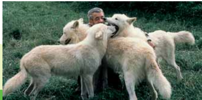
Wolfspark im Merziger Kammerforst