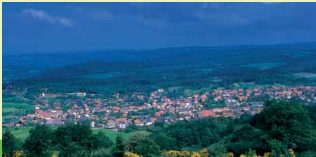
Blick auf Tholey

Streckenlänge: ca. 22,5 km Wander-Zeit: ca. 5 Std. Sehenswürdigkeiten: Benediktinerabtei Tholey • Tholeyer Doppelkreuz • Steinbildhauersymposion • Wendalinusbasilika • Völkerkundliches Museum • Museum Mia Münster • Kugelbrunnen Startpunkt: S Linie R2, Haltestelle Oberthal, Therre Endpunkt: E Linie R2, Haltestelle St. Wendel, Bahnhof